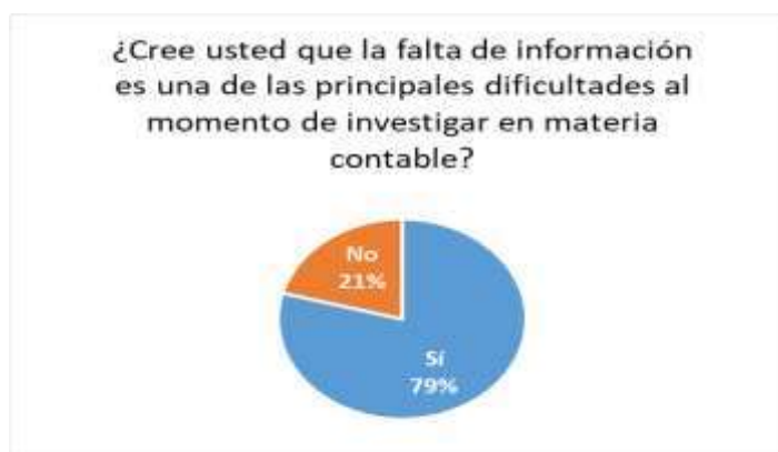
Gráfico 3. Problemática de la falta de información.

Finalmente, el cuestionario se cierra indagando a los encuestados acerca si la falta de información es una de las principales dificultades al momento de investigar en materia contable, evidenciando que la mayoría de la población (ver gráfico 3) considera que en cuestión si es así, por diversas razones (ver tabla 6), que radican en la ausencia de un organismo que recopile, analice, investigue y transmita la información necesaria para el desarrollo de la ciencia contable en materia académica, profesional y científica.