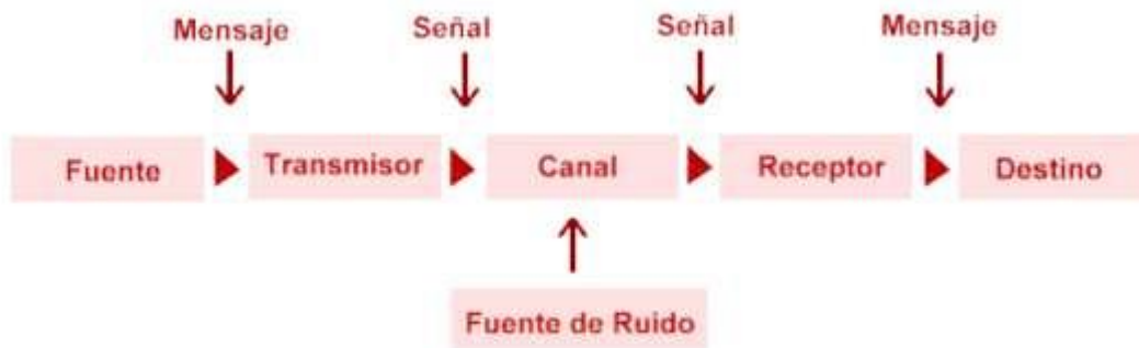
Ilustración 1 Modelo Shannon-Weaver de comunicación