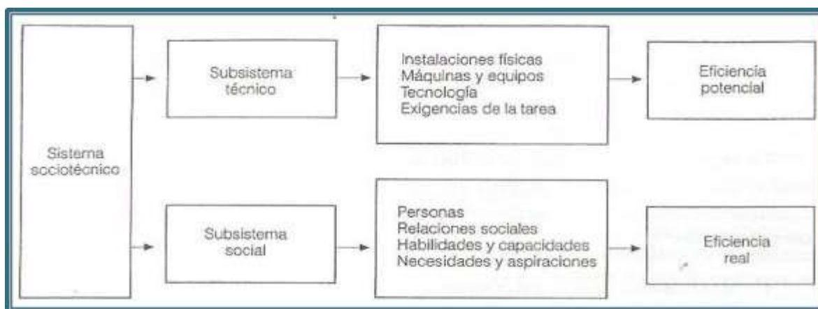
Ilustración 3 El sistema sociotécnico