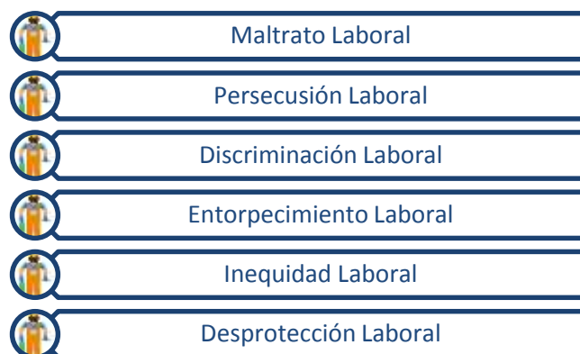
Tabla 1. Modalidades de acoso laboral